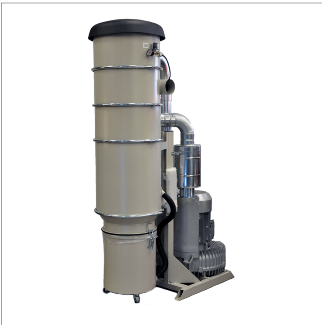
CE-13 - Suction unit

Käyttökohteet • Teollisuussivous • Hitsauskäryjen kohdepoisto • Hiontapölyille