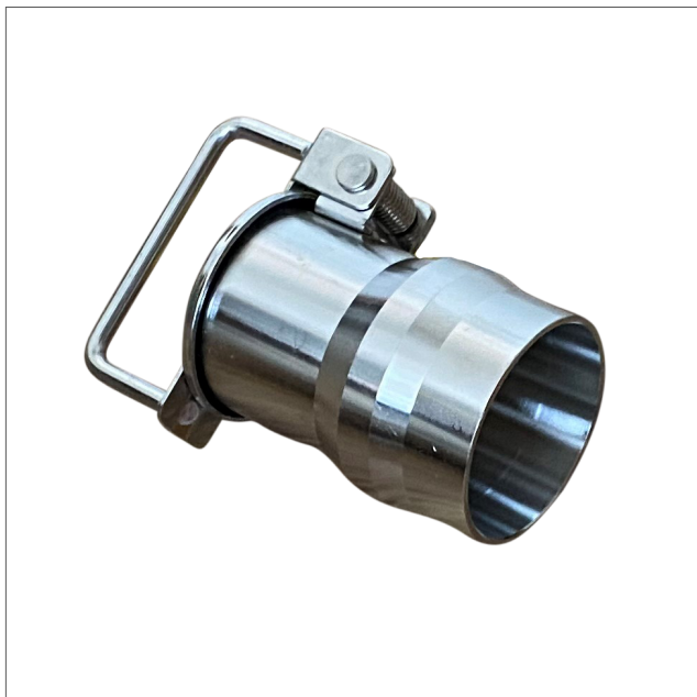
KLVS - Flap valve stainless