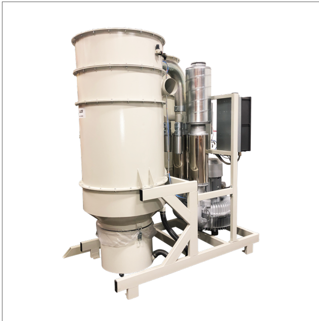
CE-25 plug and play vacuum unit